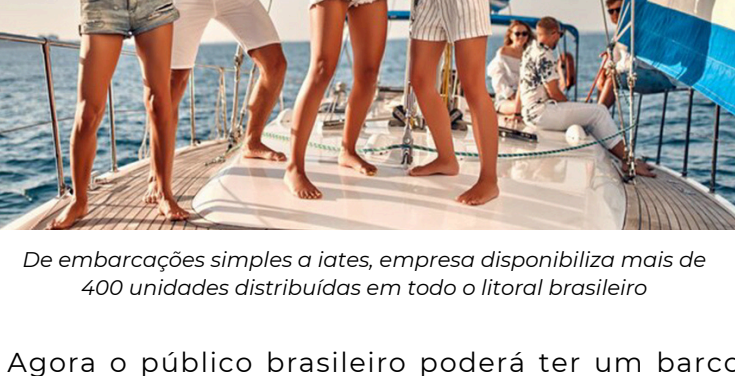
De embarcações simples a iates, empresa disponibiliza mais de 400 unidades distribuídas em todo o litoral brasileiro.

Agora o público brasileiro poderá ter um barco para chamar de seu. A BnBoats , que iniciou suas operações recentemente, chegou ao mercado brasileiro para democratizar o setor náutico , disponibilizando para locação cerca de 400 embarcações espalhadas por todo o litoral brasileiro .